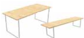
COD. 06882 Tavolo modello birreria 220x80xH72 cm COD. 06883 Panca per tavolo modello birreria 220x25 cm