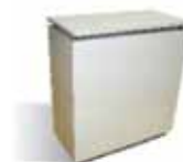
COD. 06747 Banco reception moduli da 95x50xH100 cm