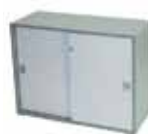
COD. 06829 Armadietto Fly (grigio con chiave) 95x45xH73 cm