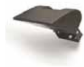
COD. 09005 Faretto Prisma 300 W