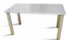
COD. 06881 Tavolo scrivania Millerighe 140x70xH73 cm